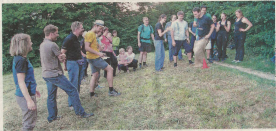
Spiel, Spass und viel Lachen stehen beim Vita-Parcours-Fest im Vordergrund.

Mit diesem Fest wollen die Organisatoren die Bevölkerung auf das Vorhandensein des Vita-Parcours aufmerksam machen. Eine Sportstätte in freier Natur, die sich gerade vor der Haustüre befindet. Damit die Fussballfans ja nichts verpassen, wird sogar das Viertelfinale der WM live auf Grossleinwand übertragen. Speis und Trank gibt es im romantischen Waldbeizli.